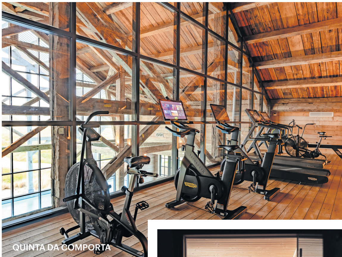
QUINTA DA COMPORTA